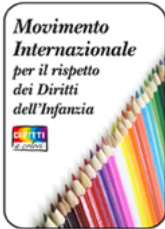
Movimento Internazionale per il rispetto dei Diritti dell'Infanzia

Published on www.dirittiacolori.it - Network per i Diritti dei bambini ( http://www.dirittiacolori.it )