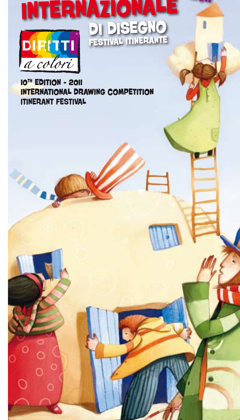
Illustrazione di Richolly Rosazza. Si ringrazia l'agenzia pubblicitaria Pallino&Co. per la realizzazione grafica. Illustration by Richolly Rosazza. Thanks to Pallino&Co. advertising agency for the graphic realization.